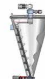
Mixer & Blandare