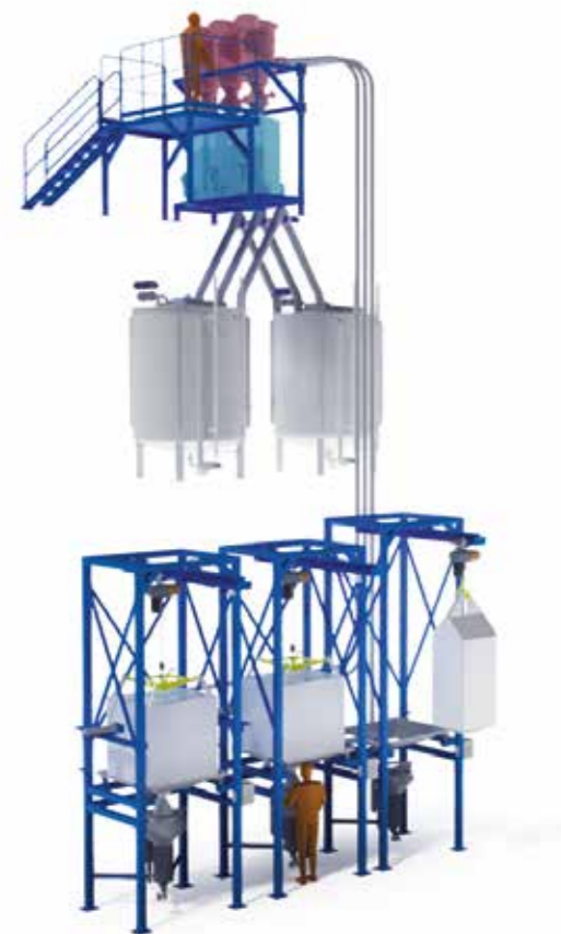
Storsäckstömmare, vakuumtransportörer, doserare, tvåvägsfördelare.

Till IBC kan du vända dig för en helhetslösning där vi kan ta ansvar för tex en del av en fabrik eller ett processteg. Vi kan ta fram en lösning inklusive el och styrning, montage och idrifttagning utefter kundens behov.