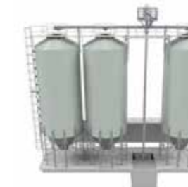
Silo & Behållare