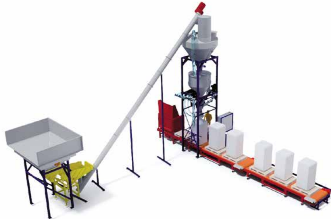
Tippficka, siktning, skruvtransportör, storsäcksfyllare, ackumuleringsbanor