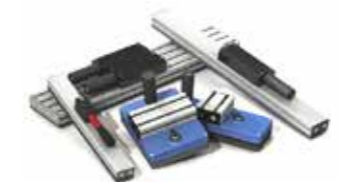
Vakuumverktyg & Grippers