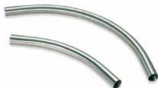
Rörböjar i rostfritt stål

Rör har lägre friktion - snabbare och smidigare transport - än slangar och bör användas i alla stationära installationer. Den totala transportsträckan, det vertikala avståndet, antalet rörböjar, diametern, om stålrör ska användas, vakuumslangar eller en kombination av rör och slangar, typ av anslutningar mellan rören - dessa är alla faktorer som ska tas i åtanke när ett rörledningssystem ska väljas.