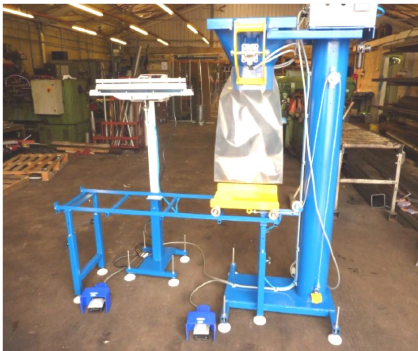
Småsäcksfyllare med vagn

IBC kan erbjuda olika typer av småsäcksfyllare – nedan ett urval: