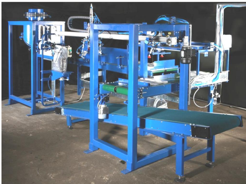
Småsäcksfyllare för ventil säckar