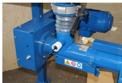
Kapacitiv givare i skruvinlopp.