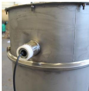
Kapacitiv givare i behållare - överfyllnadsskydd.