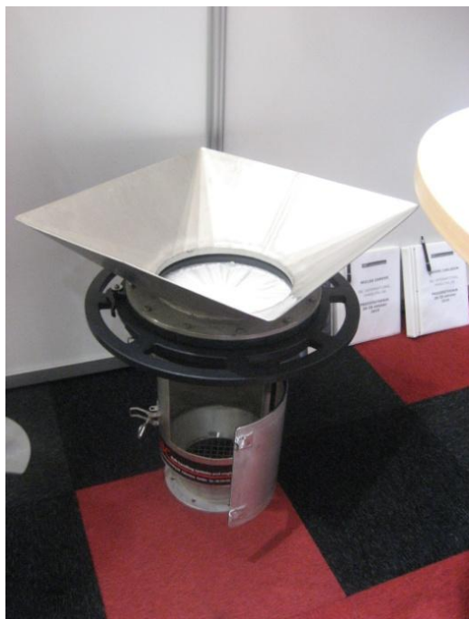
Ett irisspjäll monterat i en Bagboy Hatch.