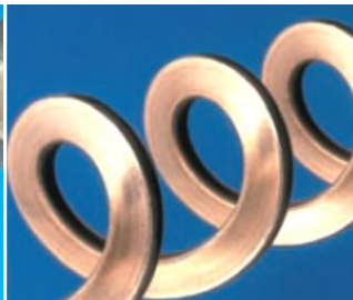
Plattspiral - ger 30% bättre prestanda.