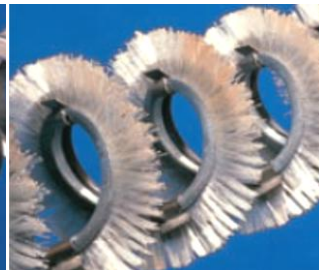
Borstspiral - för mycket vidhäftande material.