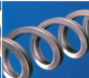
Fyrkantig spiral - för vidhäftande material.