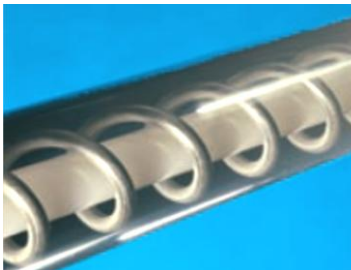
Rundprofilspiral - passar de flesta material.