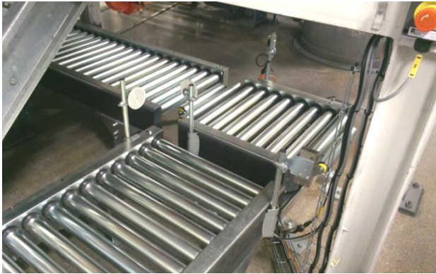
Fatet åker på rullbanorna fram till fatfyllningsstationen.