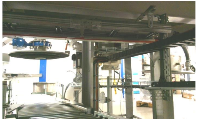
Fatfyllningsstationen sedd underifrån.