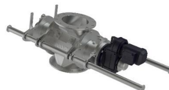
Cellmatare ZS Easy Clean Twice II För enkel rengöring av komplett cellmatare med glidstänger för utdragning.