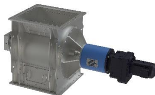
Cellmatare ZS XXL Tömning av bulk material med hög kapacitet eller låg bulk densitet.