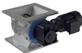
Filter cellmatare ZSFi För tömning av fririnnande bulkmaterial från filter och cykloner.