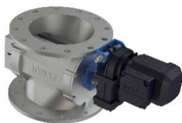
Cellmatare ZS ECO För tömning och dosering av finpartikulärt material upp till tryckskillnad på +/- 0,1 bar.