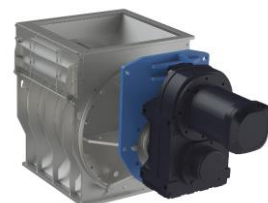
Klippande cellmatare ZSM För säker dosering och tömning av biobränslen.