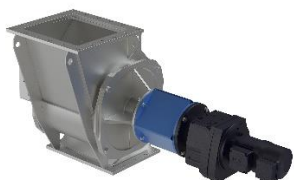
Tangentiell cellmatare ZST Tack vare den tangentiella inmatningen blir granulerade och grovkorninga bulkmaterial tömda.