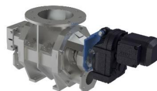
Blow-through cellmatare ZSD För inmatning av bulkmaterial in i blåstransporter. Maximalt tömnings tryck - 0,8 / + 0,8 bar