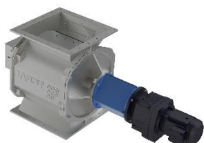
Vario cellmatare ZS Vario För dosering och tömning av fririnnande material, finpartikulärt till medium granulerat material.