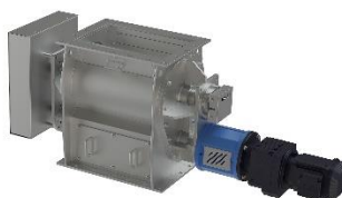
Självrengörande cellmatare ZSR En säker tömning för klubbande och produkter med dåliga flytegenskaper.