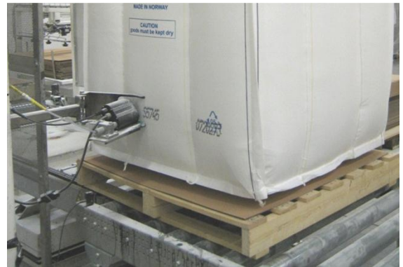
Märkning av storsäck med printer, t ex batchnr, vikt mm.