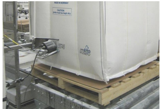
Märkning av storsäck med printer, t ex batchnr, vikt mm.