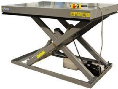
Lyftbord för ergonomisk hämtning av storsäck.