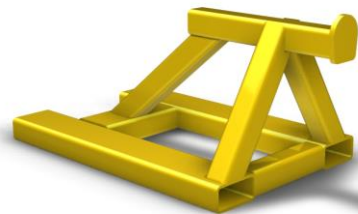
Truckok för hämtning av säck. Finns för 1, 2 eller 3 enöglesäckar samtidigt. För hämtning av mer än en säck krävs sträckning av ögla.