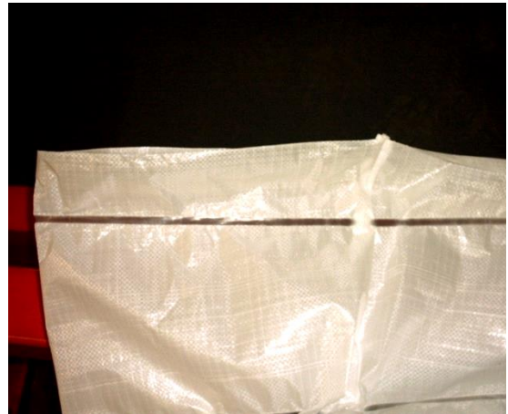
Resultat: Förseglad stos, inget materialläckage.