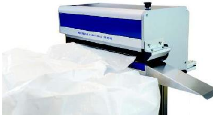
Svets av storsäcksstos. Förslutningsautomat med svetsfunktion. Inkl upphängningsram och med all erforderlig elektronik.