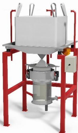
BAGBOY HYGIEN typ A Golvstativ (10a) med säckstöd (4b) och centreringsarmar (1a). Klämenhet (21) för fixering och sträckning av tömningsstos, styrd från ett pneumatiskt styrskåp (20).