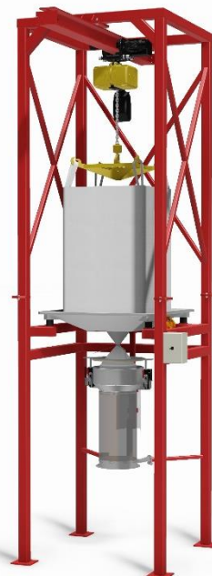
BAGBOY HYGIEN typ C Traversstativ (10c) med säckstöd (4b), eldriven kättingtelfer (17) och lyftok (18a). Klämenhet (21) för fixering och sträckning av tömningsstos, styrd från ett pneumatiskt styrskåp (20).