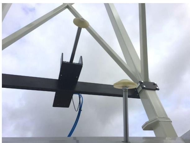
Knåddare i stativ och i tömmarskålen.