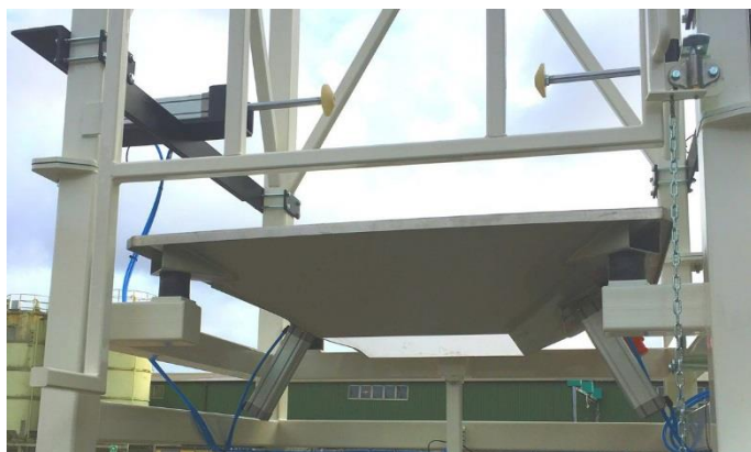
I stativet är knåddarna i ytterläge. Det finns ytterligare två knåddare i säckstödet som underlättar säcktömningen.