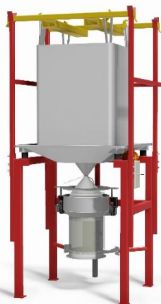
BAGBOY HYGIEN typ B Golvstativ (10b) med säckstöd (4b), säckupphängningsstativ (1b) och ok för truck eller kran (18c). Klämenhet (21) för fixering och sträckning av tömningsstos, styrd från ett pneumatiskt styrskåp (20).