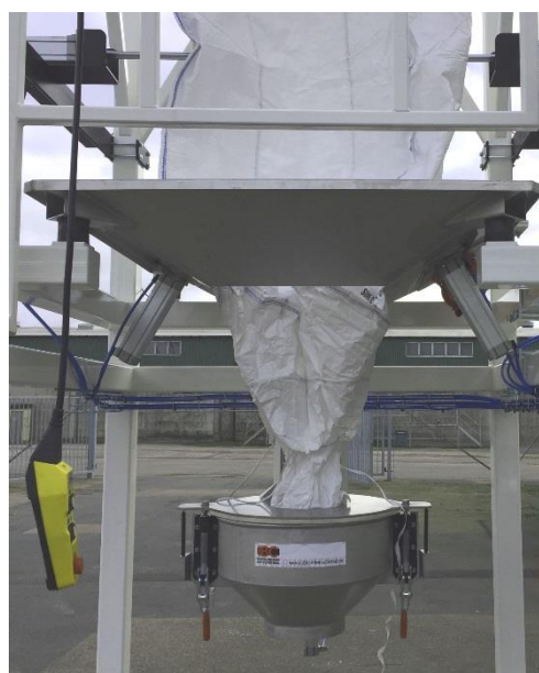
Klämenhet i stängt läge – säckstos riggad.