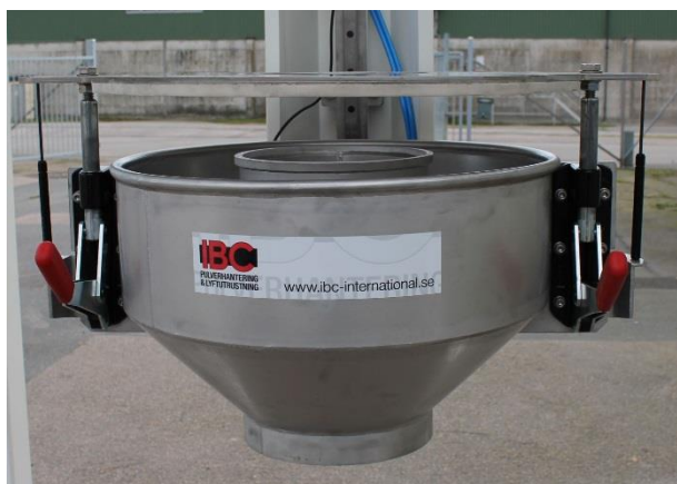
Klämenhet i öppet läge – redo för riggning av säck.

Pneumatiska pushers/knådare (25) för att underlätta materialtömning av storsäck. Placeras på stativ. Justerbara i sidled och höjdled.