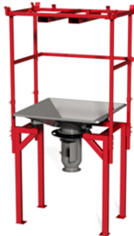
BAGBOY HATCH typ B Golvstativ (10b) med säckstöd (4b), säckupphängningsstativ (1b) och ok för truck eller kran (18c). Irisspjäll (23) och luckdel (22) för öppning av tömningsstos.