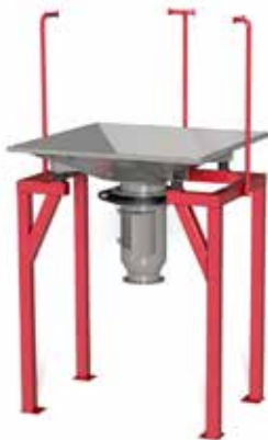
BAGBOY HATCH typ A Golvstativ (10a) med säckstöd (4b) och centreringsarmar (1a). Irisspjäll (23) och luckdel (22) för öppning av tömningsstos.