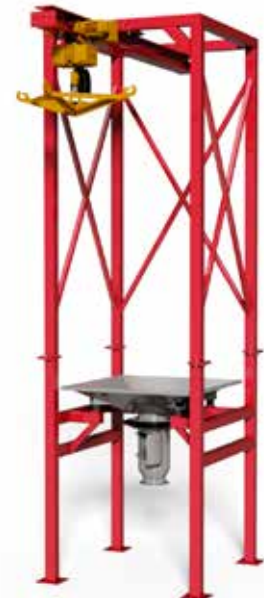
BAGBOY HATCH typ C Traversstativ (10c) med säckstöd (4b), eldriven kättingtelfer (17) och lyftok (18a). Irisspjäll (23) och luckdel (22) för öppning av tömningsstos.