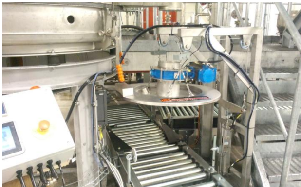
Fatet stannar under fatfyllningsstationen.