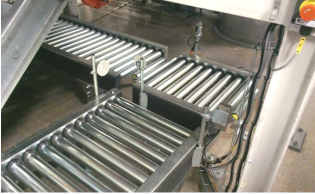
Fatet åker på rullbanorna fram till fatfyllningsstationen.