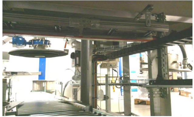
Fatfyllningsstationen sedd underifrån.